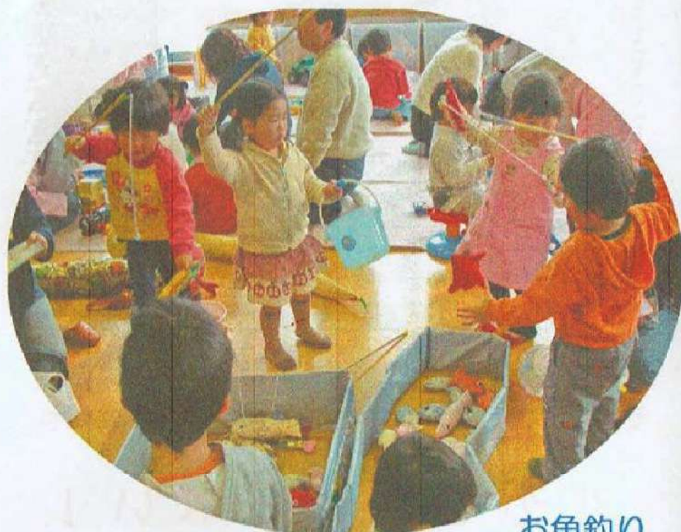
お魚釣り (手作りのお魚)

「おもちゃ図書館」は「ハンディキャップのある子どもにおもちゃのすばらしさと遊びの楽しさを・・・」との願いから始まったボランティア活動です。この活動が全国各地に広がり、ボランティアの研修会や交流会などが盛んに行われています。茂原では、茂原市社会福祉協議会のボランティア養成講座の卒業生によって、2003年に開設されました。