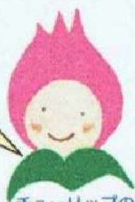
チューリップのチーちゃん