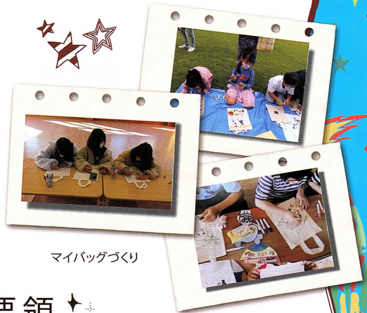
マイバッグづくり