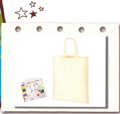
提供されるコットンバッグとペン

「おもちゃ図書館で楽しい創作活動を!」と、(株)make様より6回目となります「マイバッグづくり」の資材提供のお申し出をいただきました。応募されたおもちゃ図書館には、コットンバッグと布用のペンが送付されます。それを使って、自由に素敵なマイバッグを作りましょう。